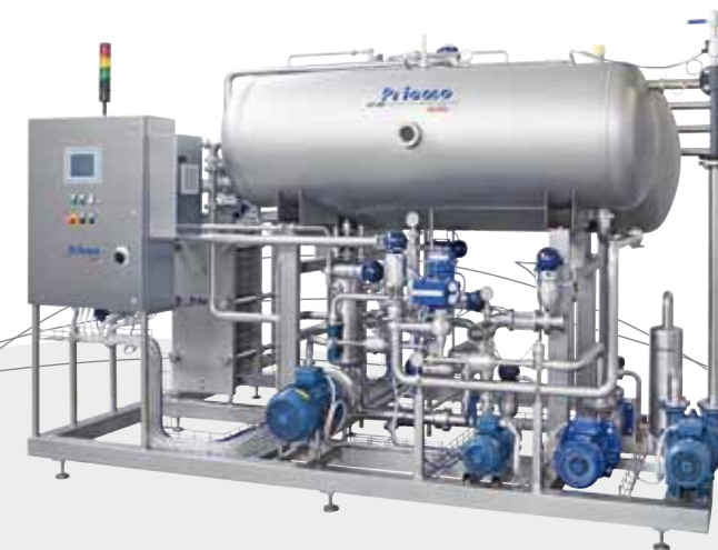
Premix / Премикс / 预混料机 / ماكينة تحضير الخلط