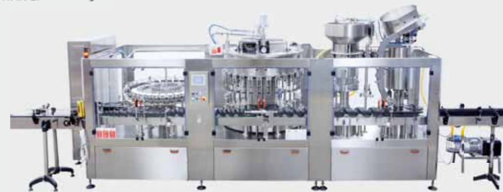
EVO-G Unibloc / Униблок EVO-G / EVO-G一体机 / EVO-G وحدة شاملة