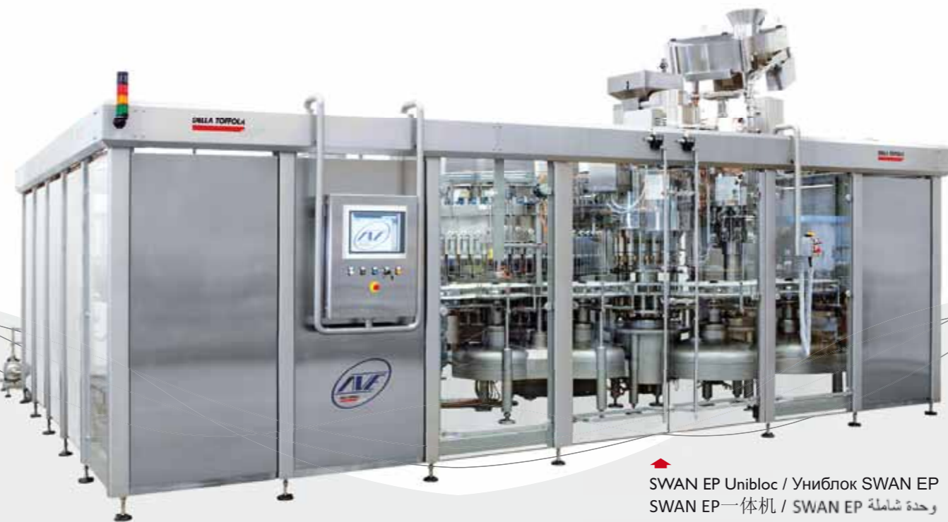
SWAN EP Unibloc / Униблок SWAN EP SWAN EP一体机 / SWAN EP وحدة شاملة