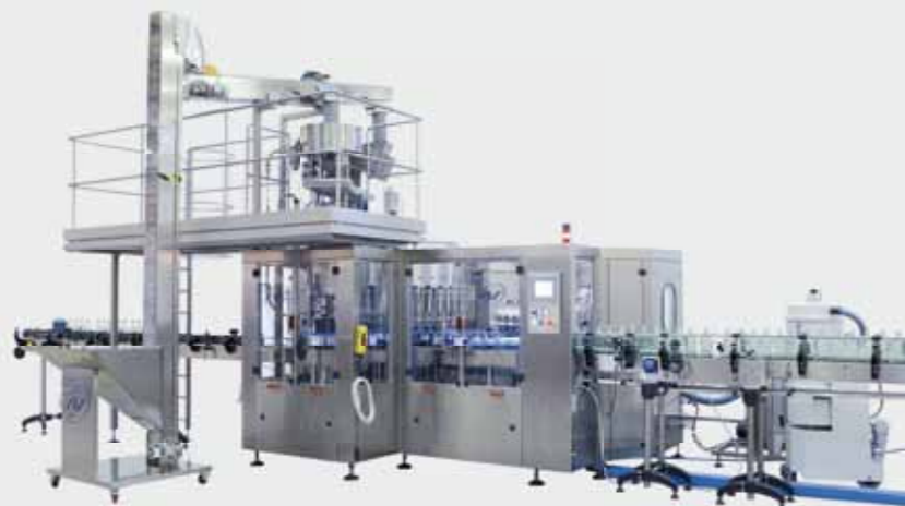
OCEANIC Unibloc / Униблок OCEANIC OCEANIC一体机 / OCEANIC وحدة شاملة