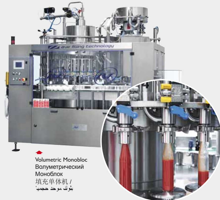
Volumetric Monobloc Волуметрический Моноблок 填充单体机 / تعبئة بوحدة حجمية