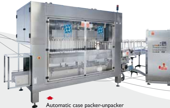
▶ Automatic case packer-unpacker Автоматический Укладчик в картонные коробки / 自动装箱/解包机 ماكينة للتعبئة في الصناديق الكرتون ونقل الصناديق التوماتيكيا