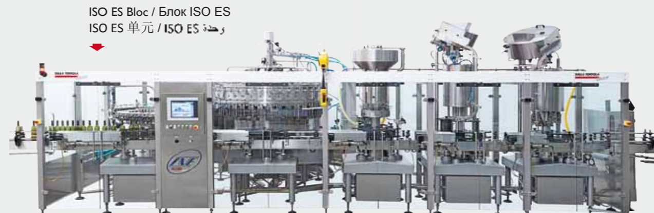
ISO ES Bloc / Блок ISO ES ISO ES 单元 / ISO ES وحدة