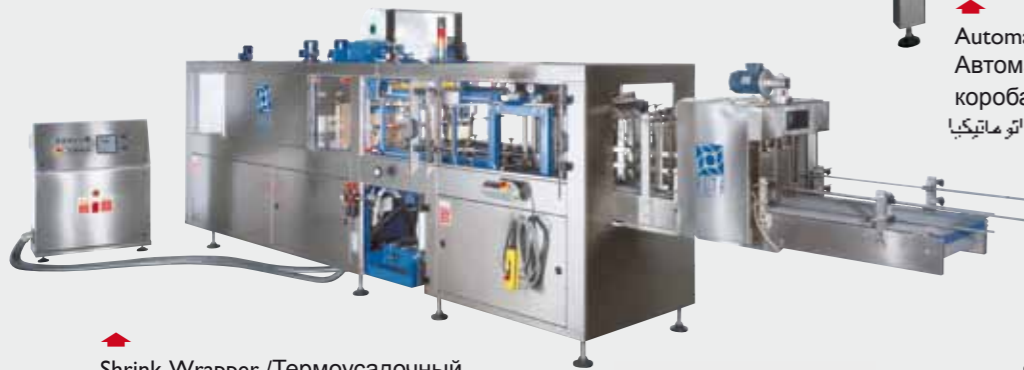
▶ Shrink-Wraper / Термоусадочный Упаковщик / 热收缩膜包装机 ماكينة تغليف بعيلم نابلون ينكمش حراريا